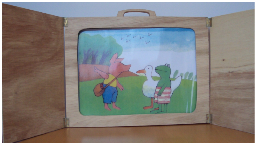
Kamischibai présentant l'histoire de Petit Bond et l'étranger

Pour préparer la présentation au Printemps de l'alpha, cet atelier lecture s'est transformé en atelier bois car le groupe a construit un Kamischibai 2 (petit théâtre de tradition japonaise) comme support à la présentation. Installés devant la structure en bois, les spectateurs écoutaient l'histoire en voyant défiler des images et l'acteur, derrière, lisait le texte qui illustrait l'image. Ce support a permis aux apprenants de travailler à plusieurs voix chacun endossant un rôle du personnage présent dans le livre. Les apprenants avaient réécrit les dialogues et jouaient les rôles. Certains avaient aussi autour du cou une affiche avec le personnage qu'ils représentaient et jouaient comme au théâtre certains dialogues du livre.